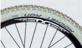
26" & 29": Die Edge-Carbon-Felgen drücken das Laufradgewicht.