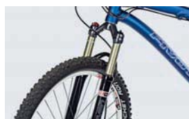
26": Auch die Manitou R7 nutzt weniger Federweg als erwartet.