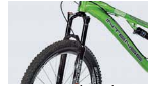
29": Die Marzocchi spricht sensibel an, ist aber sehr schwer.