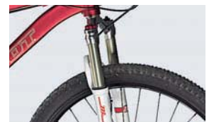
29": Manitou Minute-Gabel hat eine hohe Endprogression.