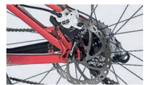
29": Die Hayes-Bremse mit 180er-Discs erwies sich als standfest.