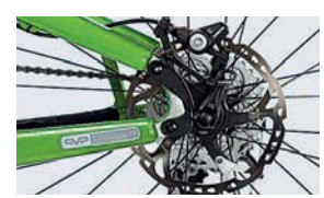
29": Die Ausfallenden sind mit dem Rahmen verschraubt.